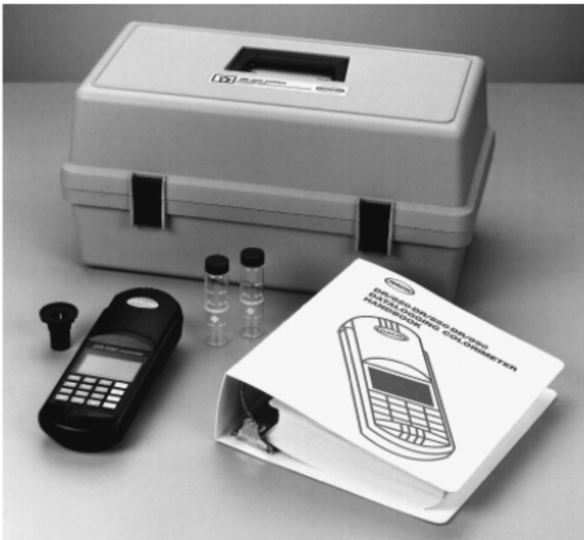
图 1 DR/800 系列色度仪标准包装*